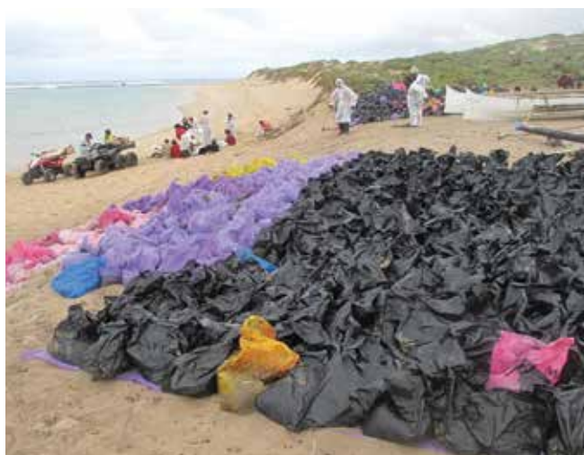
▲ Рис. 8: Полиэтиленовые мешки, содержащие собранные на пляже нефтесодержащие отходы, временно размещены выше отметки линии прибоя на полимерную подкладку для удерживания просачивающейся нефти.

Полиэтиленовые мешки должны рассматриваться как средство для перевозки, а не для хранения нефтесодержащих материалов, так как они склонны к повреждению и разложению под действием солнечного света и к вытеканию содержимого (Рис. 12). Если содержимое подлежит какой-либо обработке до утилизации, обычно бывает необходимо опустошить мешки и утилизировать их отдельно. Независимо от того, хранятся ли отходы в контейнерах, насыпью, в виде штабелей или другим способом, участок хранения должен быть огражден с обеспечением мер по улавливанию и обработке просачивающихся и вытекающих