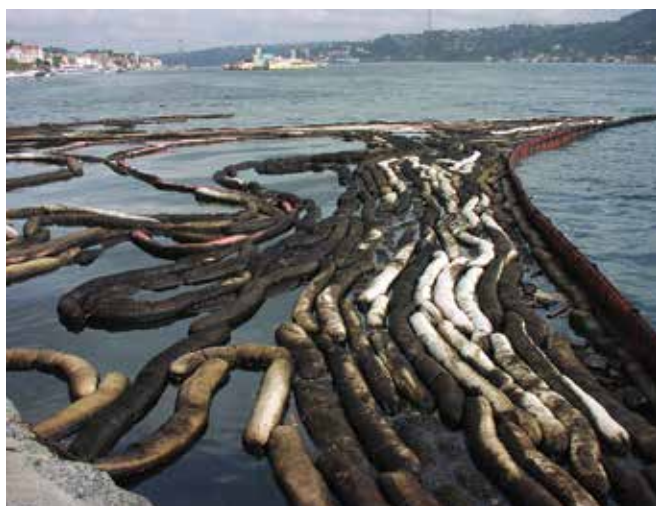
▲ Рис. 7: Частично загрязненный сорбирующий бон. Следует избегать крупномасштабного применения сорбентов для сокращения количества отходов.

Высоковязкие нефтепродукты должны храниться в открытых контейнерах, таких как баржи, скипы или барабаны для облегчения операций обработки и перекачки. Если собранную нефть требуется хранить в течение продолжительного времени, важно обеспечить хранение в закрытом контейнере, чтобы предотвратить попадание в него дождевой воды (Рис. 10),