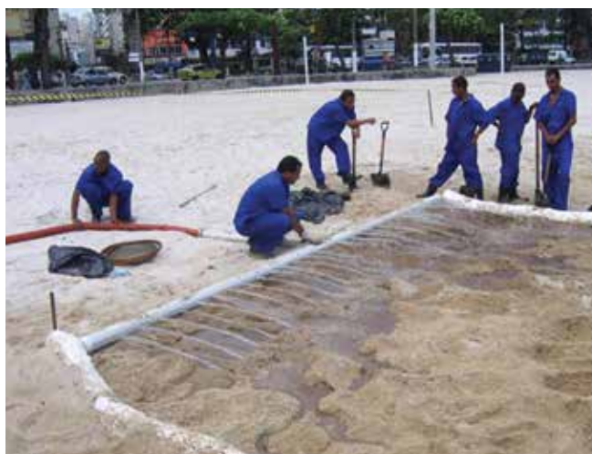
▲ Рис. 1: Очистка загрязненного нефтью песка на месте путем смывания под низким давлением с сорбирующим боном, развернутым для впитывания высвобождающейся нефти.

“Иерархия отходов” (Waste Hierarchy) - это общепринятая международная система классификации отходов и выбора приоритетных вариантов управления ими, применимая ко всем формам отходов и служащая основой для управления отходами от ликвидации разливов нефти. Иерархия включает пять отчетливых шагов в порядке их предпочтительности: