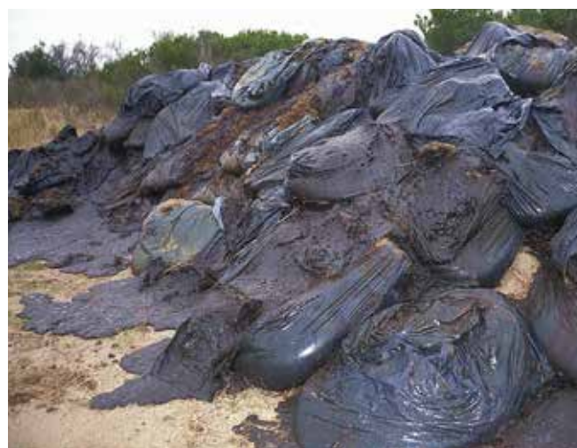
▲ Рис. 12: Разрушение полиэтиленовых мешков под длительным воздействием солнечного света может привести к повторному загрязнению.