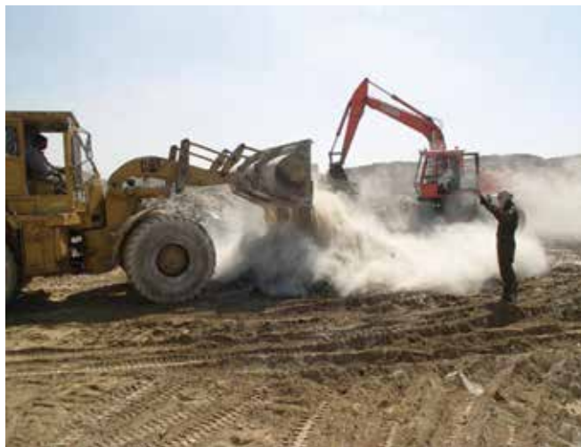
▲ Рис. 18: Стабилизация нефтесодержащих отходов с помощью негашеной извести.

Не существует универсального химреагента, способного расщеплять все виды эмульсий. Для определения наиболее эффективного реагента и его оптимальной дозировки может потребоваться провести испытания непосредственно на месте проведения мероприятий. Стандартная дозировка находится в пределах от 0,1% до 0,5% от общего объема эмульсии, подлежащей обработке. Обработка должна проводиться во время перемещения эмульсии из устройства сбора в резервуар или из одного резервуара в другой для обеспечения хорошего перемешивания и минимального расхода реагента. Деэмульгатор может быть закачан через впуск насоса