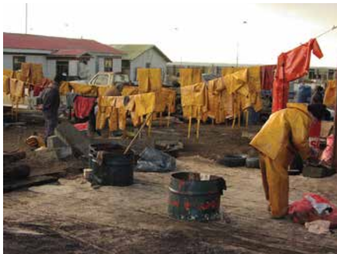
▲ Рис. 2: Снижение количества отходов является важным аспектом при реагировании на разлив. Индивидуальные средства защиты (PPE), включая одежду, должны быть очищены и, где это возможно, использованы повторно.

фактор. Однако разливы нефти часто носят аварийный характер и требуют быстрого реагирования, и если управлению отходами не будет уделено должное внимание на этапе планирования ликвидации аварийной ситуации, то наиболее экономичные и