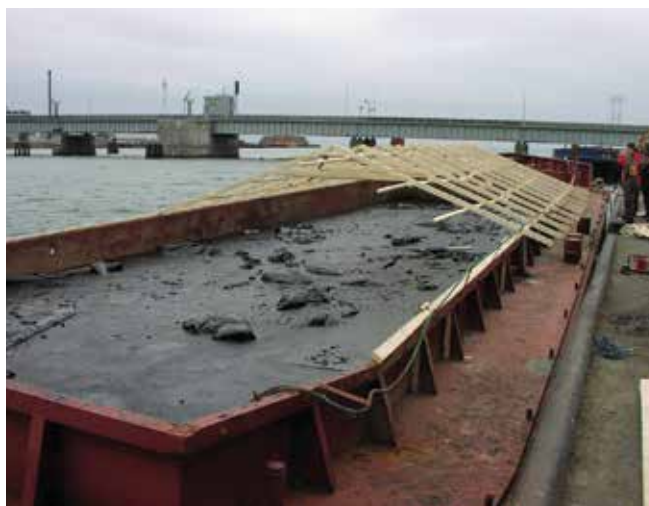
▲ Рис. 10: Собранная нефть хранится на барже. Необходимо накрыть ее для защиты от проникновения дождевой воды.