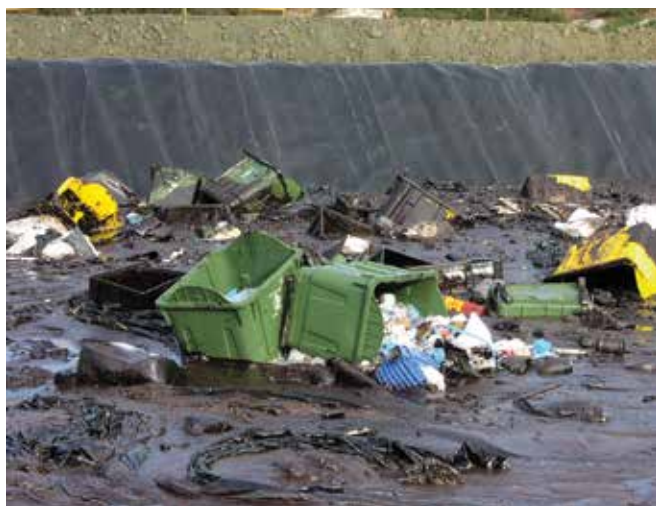
▲ Рис. 9: Надежно облицованная изнутри яма содержит неотсортированные отходы, что потребует значительных усилий по сортировке и обработке отходов.