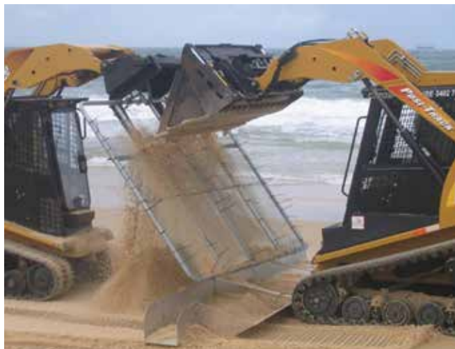
▲ Рис. 17: Механическое просеивание песка и отделение смолистых шариков для снижения количества образующихся отходов.