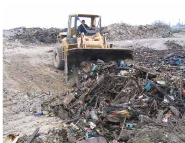
▲ Рис. 14: Удаление мусора с береговой линии до выброса нефти на берег помогает снизить количество нефтесодержащих отходов, требующих утилизации.