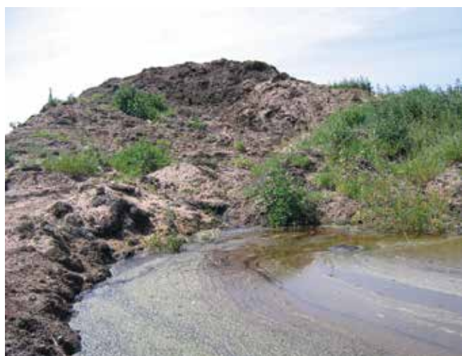
▲ Рис. 13: Удержание и обработка загрязнителя, просочившегося из нефтесодержащего песка, размещенного на временное хранение, предотвращает вторичное загрязнение окружающей территории и грунтовых вод.