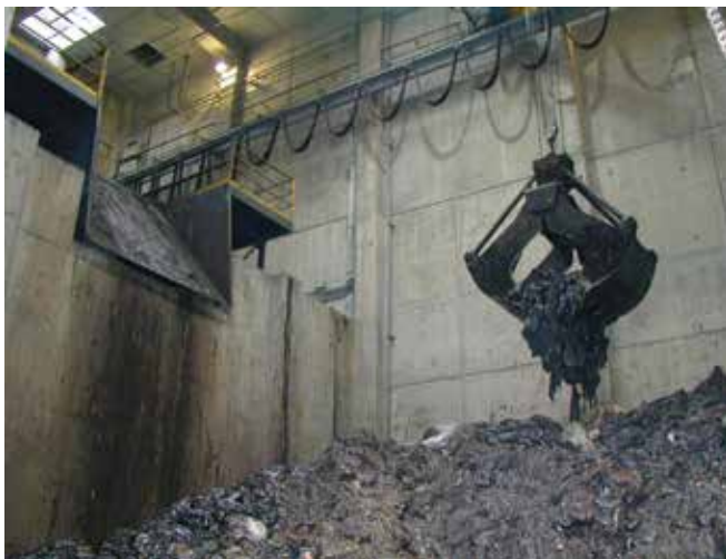
▲ Рис. 19: Мешки с нефтесодержащими отходами подаются в загрузочный люк большого промышленного инсинератора для совместного сжигания с бытовыми отходами.

анализа для контроля температуры сжигания (Рис. 19). Таким образом часто утилизируются загрязненная нефтью защитная одежда, сорбенты, сетки и другие материалы с малым содержанием нефти. Высокотемпературные промышленные инсинераторы отходов, хотя и способны сжигать отходы с высоким содержанием солей, немногочисленны и могут быть расположены в отдаленных регионах. Они могут не обладать мощностью, достаточной для того, чтобы быстро справиться с дополнительной нагрузкой в виде нефтесодержащих отходов. С другой стороны, в случае наличия мест для долгосрочного хранения, что позволило бы постепенно добавлять нефтесодержащие отходы в общий поток сжигаемых материалов, такой способ утилизации может быть приемлемым и эффективным.