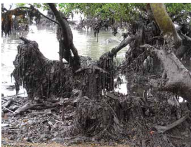
▲ Рис. 3: Пластмассовые отходы от попавших за борт контейнеров, смешанные с нефтью и выброшенные в мангровые заросли.

Транспортировка, хранение и утилизация нефтедержательных отходов должны проводиться с соблюдением местного законодательства. В некоторых странах для организации площадок временного хранения требуется получение специальной лицензии; кроме того, привлекаемые подрядчики также нуждаются в лицензии на проведение различных работ по утилизации отходов. Проведение консультаций с