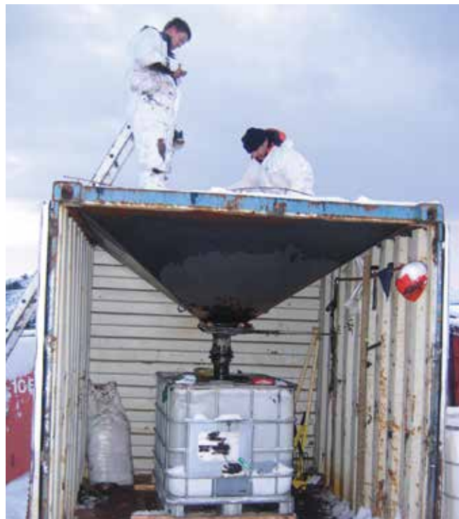
▲ Рис. 16: Импровизированная система фильтрации отходов, где собранная нефть пропускается через воронку с решеткой для фильтрации мусора.

Объем отходов также может быть снижен путем ручного извлечения нефти в форме смолистых шариков из чистого песка, когда требуется высокий стандарт чистоты территории, например на туристических пляжах. Просеивающие устройства, как статические, так и механические, также иногда используются для удаления нефтесодержащих песчаных остатков и смолистых шариков из слабо загрязненного песка (Рис. 17). Несмотря на высокую трудоемкость, очистка на месте сбора большого количества нефтесодержащих материалов в плане затрат более целесообразна, чем те методы, которые требуют транспортировки материала на некоторое расстояние от берега и последующей утилизации.