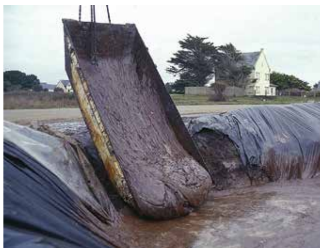
▲ Рис. 11: Выгрузка эмульгированного топлива из скипа в облицованную яму для временного хранения.

С целью снижения количества загрязненной воды, подлежащей утилизации, может быть возможно сливать воду, которая сепарировалась из водонефтяной смеси, собранной в море или