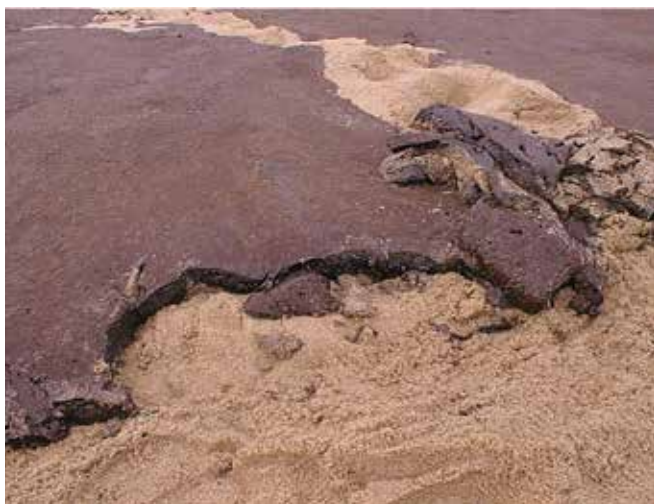
▲ Рис. 5: Эмульгированная нефть, выброшенная на берег. Избирательная ручная уборка позволяет уменьшить количество забираемого незагрязненного грунта.