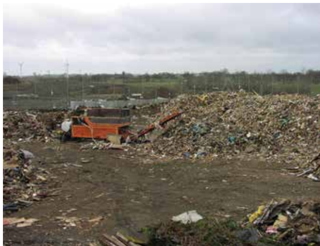
▲ Рис. 20: Свалка для отходов. При условии тщательного контроля отходы с низким содержанием нефти могут размещаться вместе с бытовыми отходами.

Биологическое восстановление - это термин, используемый для описания методов, которые ускоряют микробное разложение нефти. Одним из таких методов является возделывание земли, при котором нефть и мусор разбрасываются по отведенному участку земли. На протяжении многих лет нефтеперерабатывающие заводы создавали сельскохозяйственные территории для утилизации нефтесодержащих отходов, но законодательство все более ужесточает их использование, поэтому становится трудно найти подходящие для этого земли. Применение для целей возделывания земли возможно лишь для относительно небольших разливов из-за необходимости больших земельных