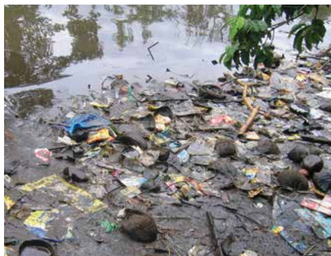
▲ Рис. 4: Нефть, смешанная с выброшенными пластмассовыми материалами, бытовым мусором, древесиной, растительностью и другими отходами.