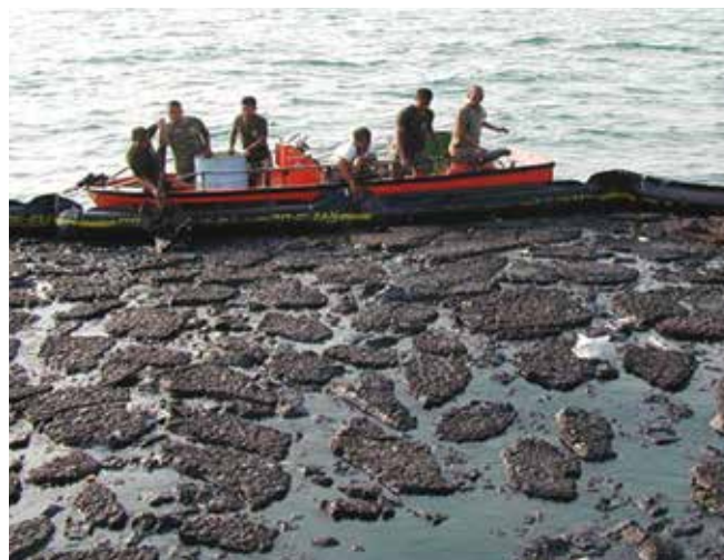
▲ Рис. 6: Полутвердая нефть, сдерживаемая внутри бона. Трудность прокачки нефти может ограничивать возможности различных способов утилизации.